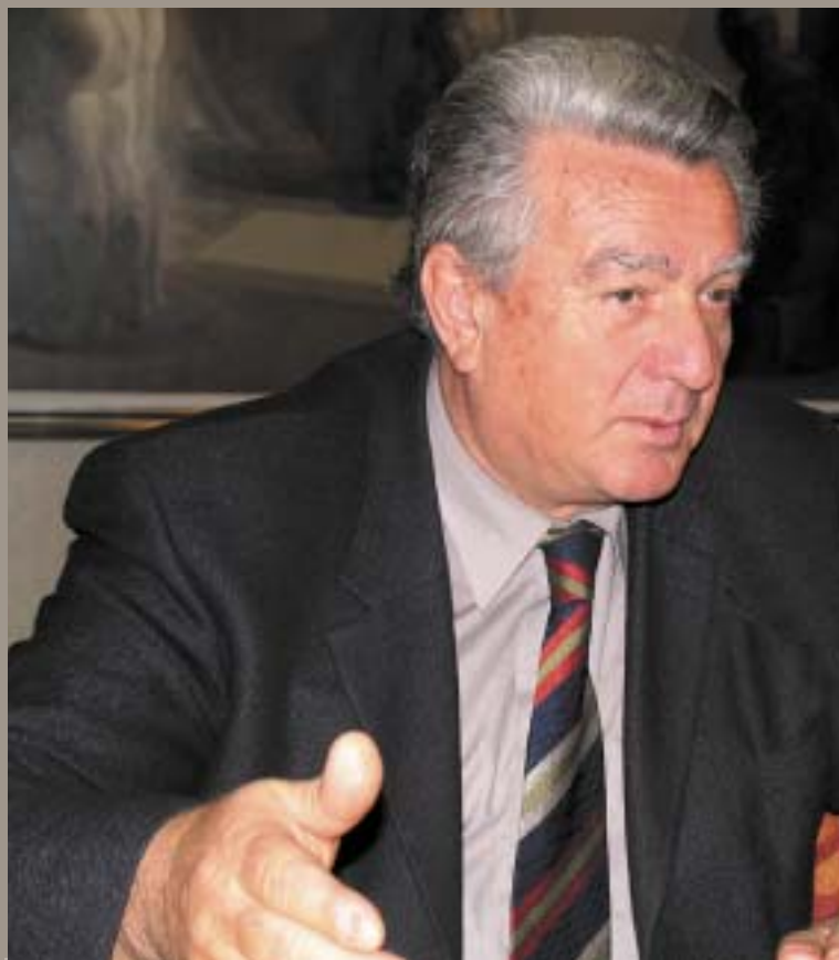
Кај организираниот криминал и корупцијата доаѓа до таква симбиоза, тоа е криминал од симбиотички тип.

КАМБОВСКИ: Видете, бидејќи на тој Закон за корупција работев уште во 1997 година и овој Закон едвај се "испили", по многу долги години, па беше усвоен дури во 2002 година, значи по пет години од почнувањето со работата, во периодот кој имаше долги дискусии, меѓу другото, и за карактерот на Антикорупциската комисија, цело време во воздухот лебдеше прашањето дали нашата комисија ќе ја претвориме во паралелен орган на полицијата или на Јавното обвинителство, некој истражен орган и слично. Дали тоа е добро да го направиме? Дали нешто сме постигнале ако кажеме дека Јавното обвинителство или, пак, полицијата не функционираат, па ајде ќе фор-