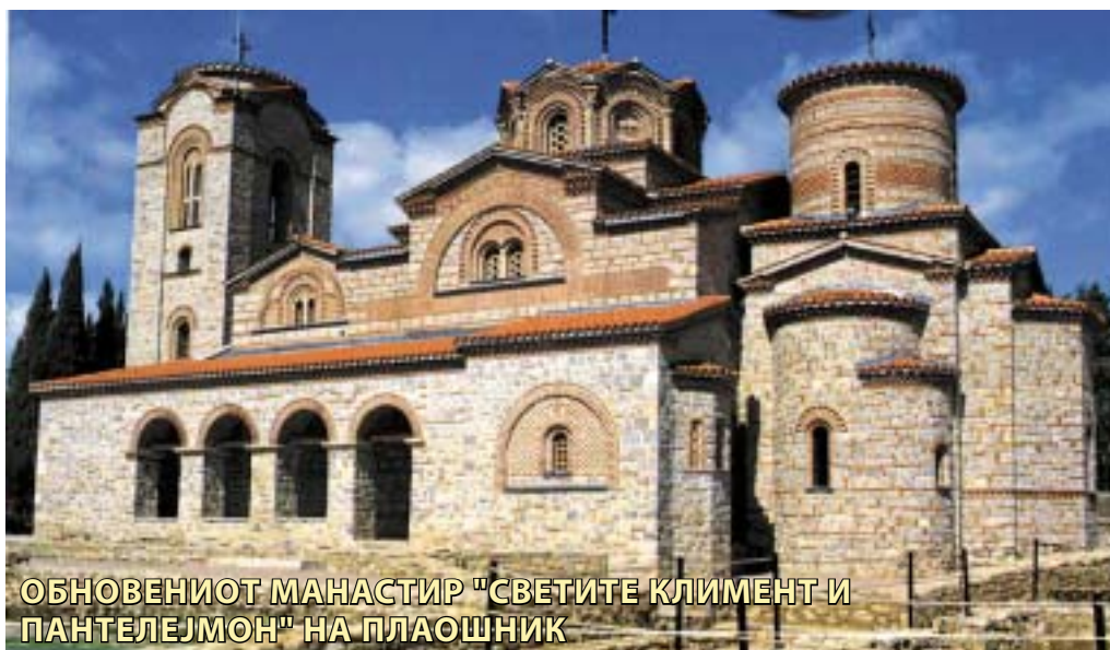
ОБНОВЕНИОТ МАНАСТИР "СВЕТИТЕ КЛИМЕНТ И ПАНТЕЛЕЈМОН" НА ПЛАОШНИК

формирал во кирилица. Автор е на "Пофалното слово за Кирила", на "Панонските легенди" - дело за животот на