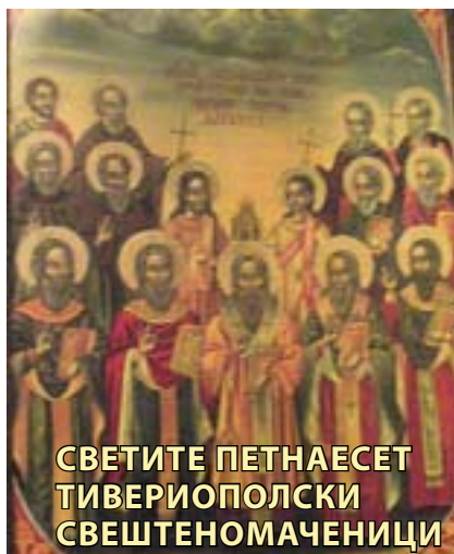
СВЕТИТЕ ПЕТНАЕСЕТ ТИВЕРИОПОЛСКИ СВЕШТЕНОМАЧЕНИЦИ

формирал во кирилица. Автор е на "Пофалното слово за Кирила", на "Панонските легенди" - дело за животот на