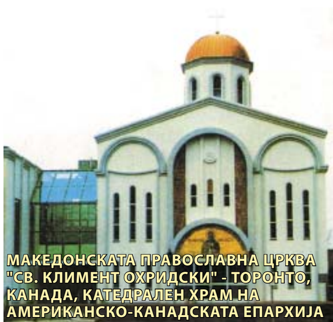
МАКЕДОНСКАТА ПРАВОСЛАВНА ЦРКВА "СВ. КЛИМЕНТ ОХРИДСКИ" - ТОРОНТО, КАНАДА, КАТЕДРАЛЕН ХРАМ НА АМЕРИКАНСКО-КАНАДСКАТА ЕПАРХИЈА

во гробот кој самиот тој го подготвил со свои раце. Но, подоцна неговите нетрулежни мошти биле пренесени во црквата "Света Богородица Перивлепта". Во 2002 година, во август, неговите чудотворни мошти со најголема свеченост беа пренесени во осветениот и обновен манастир на "Св. Климент и Пантелејмон" на Плаошник. Тие се наоѓаат во оригиналниот саркофаг каде што тој бил погребан.