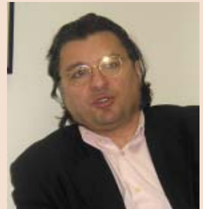
Д-Р ЛЉБОМИР ФРЧКОСКИ (23.2.1996-29.5.1997)