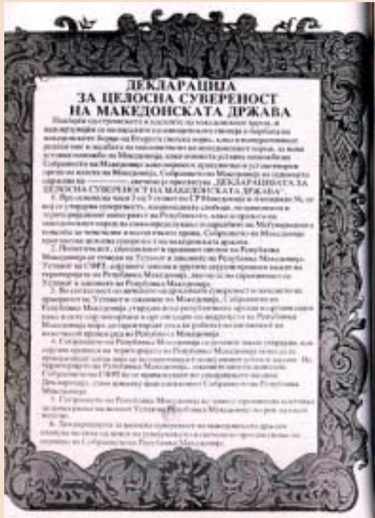
"ДЕКЛАРАЦИЈА ЗА ЦЕЛОСНА СУВЕ ДРЖАВА", СЛИЧНА НА СЛОВЕНЕЧ

на сувереност. Таа стратегија ги содржеше следните насоки: наместо Собранието да усвои една дефинитивна декларација, да се усвојуваат етапно повеќе декларации; да се распише референдум; да се изработи и да се усвои нов устав; да се разговара со поранешната ЈНА за нејзино мирно напуштање на Македонија; да се спроведе монетарно осамостојување; да се донесат закони за армијата, за полицијата и за симболите на државата; да се извести меѓународната заедница, да се побара меѓународно признавање и прием во европските институции и во ООН. Како дел од оваа стратегија, на 25 јануари 1991 година Собранието ја усвои својата прва Декларација за сувереност на Социјалистичка Република Македонија. Исто така, беше дефинирано со декларациите да се покаже дека македонскиот народ, заедно со другите малцинства (националности),