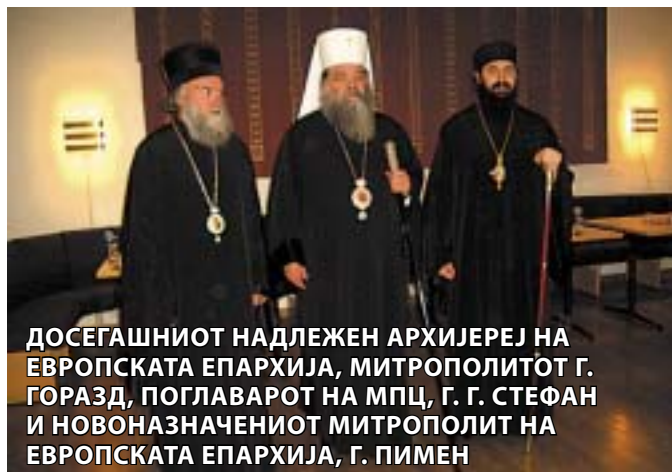
ДОСЕГАШНИОТ НАДЛЕЖЕН АРХИЈЕРЕЈ НА ЕВРОПСКАТА ЕПАРХИЈА, МИТРОПОЛИТОТ Г. ГОРАЗД, ПОГЛАВАРОТ НА МПЦ, Г. Г. СТЕФАН И НОВОНАЗНАЧЕНИОТ МИТРОПОЛИТ НА ЕВРОПСКАТА ЕПАРХИЈА, Г. ПИМЕН