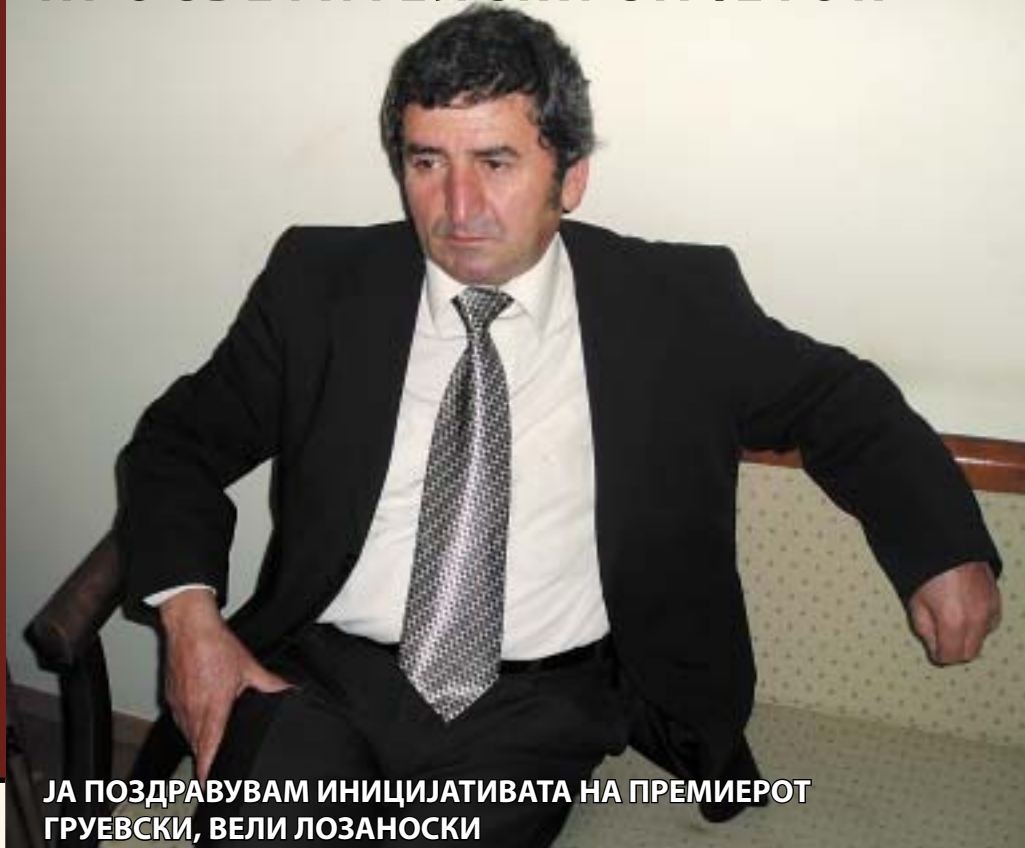
ЈА ПОЗДРАВУВАМ ИНИЦИЈАТИВАТА НА ПРЕМИЕРОТ ГРУЕВСКИ, ВЕЛИ ЛОЗАНОСКИ

Светиклиментовиот универзитет не е само прв македонски универзитет, туку има и пошироки размери и претставува и прва македонска Академија на науките и уметностите.