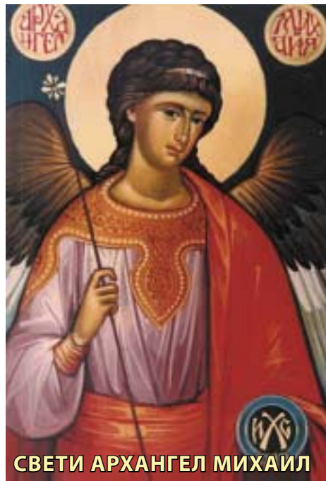
СВЕТИ АРХАНГЕЛ МИХАИЛ

За зачувување на нашата света православна вера и прастара традиција, за сведоштво на сегашните и на идните генерации, во Македонија, во близина на Велес, над селото Теово, во пространите зелени ливади, на природна висорамнина од која може да се гледа во далечина, последниве години Милостивиот Бог ја изли Својата благодет, овде, на ова место, да се изгради еден прекрасен манастирски комплекс посветен на Свети Архангел Михаил. Бог му ја покажа на македонскиот народ светлината на Своето лице.