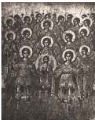
СОБОР НА СВЕТИТЕ АНГЕЛСКИ БЕСТЕЛЕСНИ СИЛИ

Тогаш, во својата злоба, понижен и победен, сатаната поч-