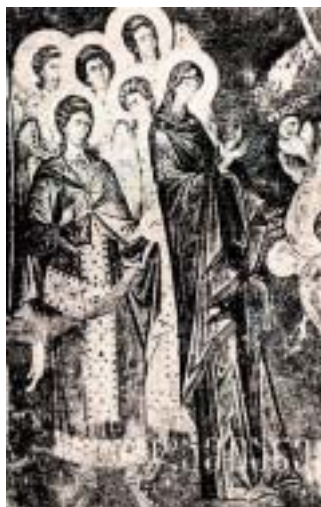
ПРЕСВЕТА БОГОРОДИЦА СО СВЕТИТЕ АНГЕЛИ СЕ МОЛИ ЗА НАС ПРЕД ХРИСТОС

чи крепост Божја. Тој е благовестител на тајните Божји. Свети Рафаил значи исцеление Божјо или Бог исцелител. Тој е исцелител на болестите. Свети Урил на еврејски значи оган Божји или светлост Божја. Тој е служител на Божествената љубов. Ја распламува во срцата љубовта кон Бога. Свети Салатил значи молитвеник Божји. Свети Јегудил значи славител Божји. Свети Варахил значи благослов Божји. Свети Еремил значи возвишување Божјо. Сите ангели се природа разумна, обдарени со ум и слободна волја, во служба на Бога и спасение на човештвото.