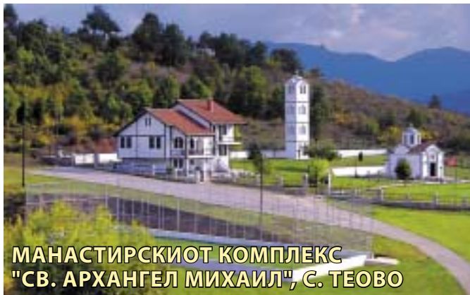
МОНАСТИРСКИОТ КОМПЛЕКС "СВ. АРХАНГЕЛ МИХАИЛ", С. ТЕОВО

Во Светото Писмо е опишан како верен и храбар Архангел Божји, заштитник на христијаните. Кога сатаната Луцифер, од завист кон Бога, горделиво посакал да биде еднаков со Бога и се откажал од Бога, отпаднал од Бога и со себе повлекол и дел од ангелите. Тогаш настанала страшна војна на небото. Архангел Михаил храбро застанал на чело на целиот Собор од ангели и извикал: "Да внимаваме! Да застанеме добро, да застанеме со