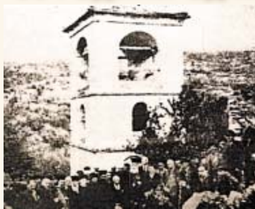
ПОГРЕБОТ НА ГОЦЕ ДЕЛЧЕВ ВО СЕЛО БАНИЦА