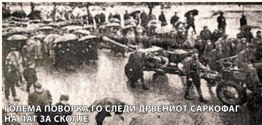
ГОЛЕМА ПОВОРКА ГО СЛЕДИ ДРВЕНИОТ САРКОФАГ НА ПАТ ЗА СКОПЈЕ

Годинава се навршуваат 134 години од раѓањето (1872-2006), 103 години од смртта (1903-2006) и 60 години (1946-2006) од пренесувањето на моштите на Гоце Делчев, великанот и еден од апостолите на македонската револуционерна организација од крајот на XIX век и почетокот на XX век. Токму поради овие значајни датуми за македонската историја тројцата автори проф. д-р Марјан Димитријевски, Бранка Илијевска и Перса Билинска од Националната установа - козерваторски центар од Скопје, почитта кон големиот Делчев решија да ја искажат преку промовирање на книгата "Пренесувањето на мош-