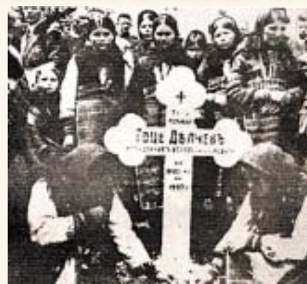
МАКЕДОНСКИТЕ ЖЕНИ ГО ОПЛАКУВААТ ГОЦЕ ДЕЛЧЕВ

тите на Гоце Делчев во Скопје 1946-2006 (60 години)". Ова одбележување, поинакво од сите останати, поврзано со 60-годишнината од пренесувањето на посмртните останки на Гоце на знаменитото место - светиот православен храм "Свети Спас" и похранувањето во саркофагот поставен среде македонската престолнина е повторна можност за навраќање кон овој значаен македонски историски настан.