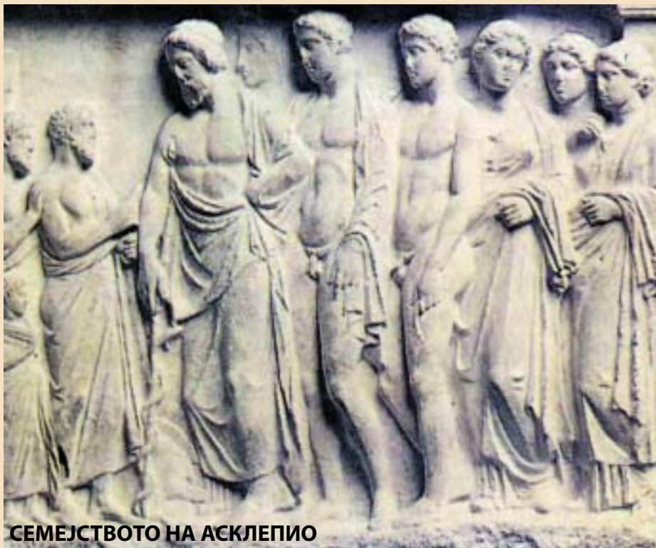
СЕМЕЈСТВОТО НА АСКЛЕПИО

се боготворат. Тоа не е случај само со Херакло, Дионис, Аполон, туку и со Ахил, Одисеј, Александар и со многу луѓе, како и Исус Христос. Ангелите и Мачениците си нашле место меѓу боговите и народот, како такви ги славиме. Браќата близнаци звезди Плејади Кастор и Полидевк низ Македонија биле многу славени. Нивниот култ како коњаници често се сретнува и во светилиштата и на надгробните стели. Тоа се браќата на Елена која од сидините на Троја не можела да ги согледа во војските. Тие веќе го предводеле небескиот одред на божества, херои и цареви, подеднакво славни и заслужни за своите дела извршени меѓу луѓето. Плејадите, заедно со синови на богови како Орфеј, Херакло, Пелеј, Теламон, пророкот Мопс, сите храбри луѓе, богови и цар-