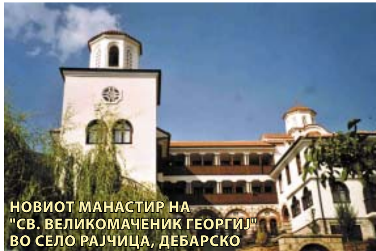
НОВИОТ МАНАСТИР НА "СВ. ВЕЛИКОМАЧЕНИК ГЕОРГИЈ" ВО СЕЛО РАЈЧИЦА, ДЕБАРСКО

Слугата го запишал завештението на Свети Георгиј и го извршил. Свети Георгие, светило бесмртно на земјата и во Царството Небесно! Како намачен патник во ноќта, кој по тешко чекорење ја согледа прекрасната зора на ис-