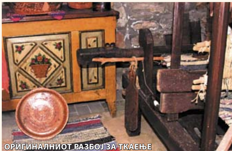
ОРИГИНАЛНИОТ РАЗБОЈ ЗА ТКАЕЊЕ