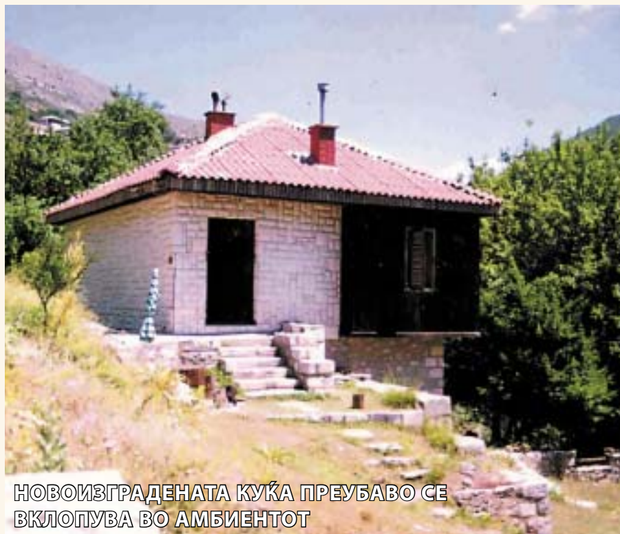
НОВОИЗГРАДЕНАТА КУЌА ПРЕУБАВО СЕ ВКЛОПУВА ВО АМБИЕНТОТ