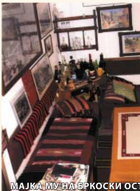
МАЈКА МУ НА БРКОСКИ ОСТАВИЛА ПОЛНА КУЌА, НО НИКОГАШ НЕ СЕ ВРАТИЛА ВО НЕА

"Мајка ми ја заклучила куќата и клучот го оставила под камената плоча на прагот. Паметам дека секогаш велеше: 'Оставив полна куќа за да се вратам некогаш, тука на своето огниште'. За жал, никогаш не успеа да се врати. Клучот го најдов јас, кога ги