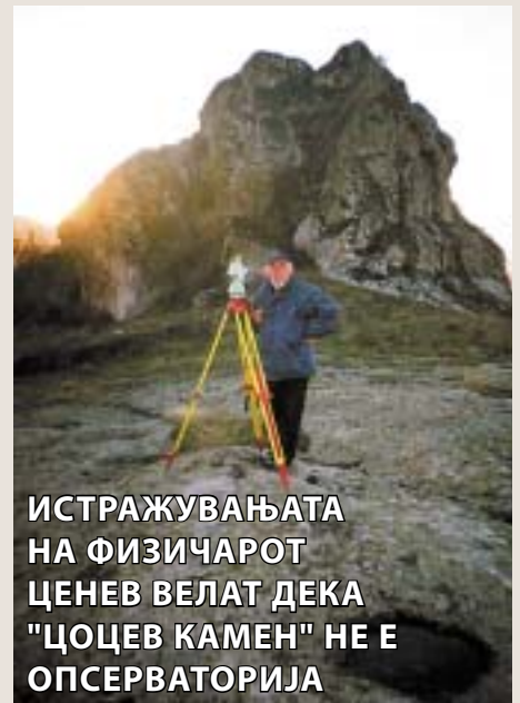
ИСТРАЖУВАЊАТА НА ФИЗИЧАРОТ ЦЕНЕВ ВЕЛАТ ДЕКА "ЦОЦЕВ КАМЕН" НЕ Е ОПСЕРВАТОРИЈА