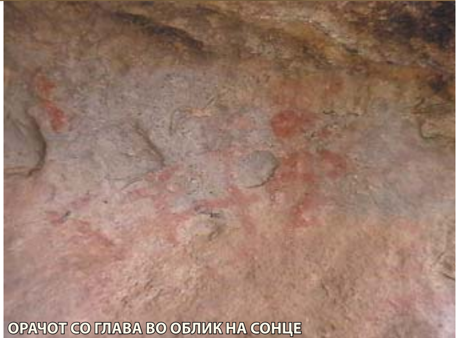
ОРАЧОТ СО ГЛАВА ВО ОБЛИК НА СОНЦЕ

техника на тоа централно место. Дојдов до сознание дека луѓето го избрале ова место од некоја причина и сега треба да се види зошто така направиле. Констатацијата е дека ова е чист исток, најверојатно станува збор за моментот кога е Рамноденица, момент кога на одредено место излегува сонцето", вели д-р Масон.