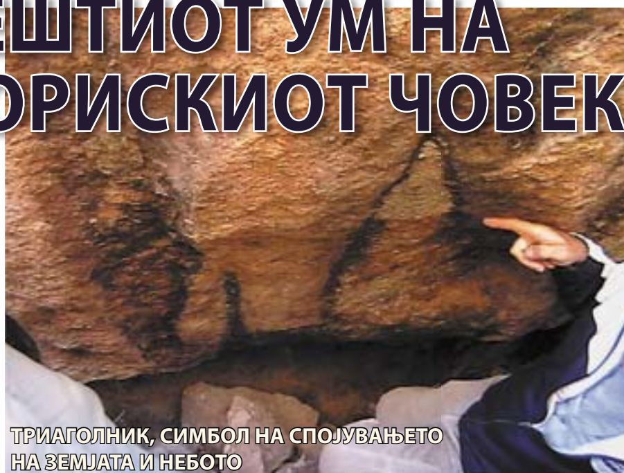
ТРИАГОЛНИК, СИМБОЛ НА СПОЛУВАЊЕТО НА ЗЕМЈАТА И НЕБОТО