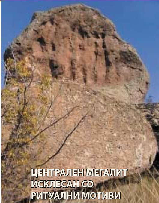
ЦЕНТРАЛЕН МЕГАЛИТ ИСКЛЕСАН СО РИТУАЛНИ МОТИВИ