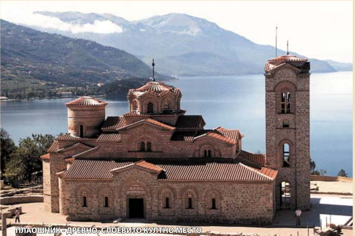
ПЛАОШНИК - ДРЕВНО, СЛОВИТО КУЛТНО МЕСТО

С ите посланија и евангелија се запишувани во македонските градови. Само за пример, апостол Павле проповедал во Цариград, Филипи, Лихнида, Хераклеја, Стоби, Солун, Коринт. Во сите тие градови постоеле големи театри, собиралишта на македонскиот народ, потоа претворени во милосрдни центри на новата вера, на истите светилишта и лекувалишта, покрај свети води. Црковните економии ги обезбедувале храната, хигиената и лековите кои се добивале од билки. Целото свештенство ја презело богатата македонска медицинска традиција низ европските манастири и денес, како свои рецепти, нудат разни напивки и мевлеми, кои ги подготвувале Македонците од пред неколку илјади години.