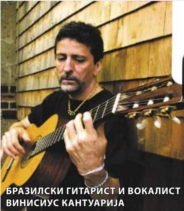
БРАЗИЛСКИ ГИТАРИСТ И ВОКАЛИСТ ВИНИСИУС КАНТУАРИЈА