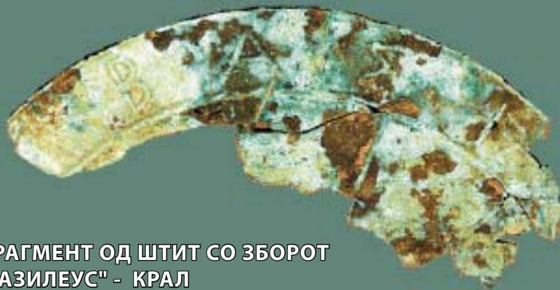
ФРАГМЕНТ ОД ШТИТ СО ЗБОРОТ "БАЗИЛЕУС" - КРАЛ