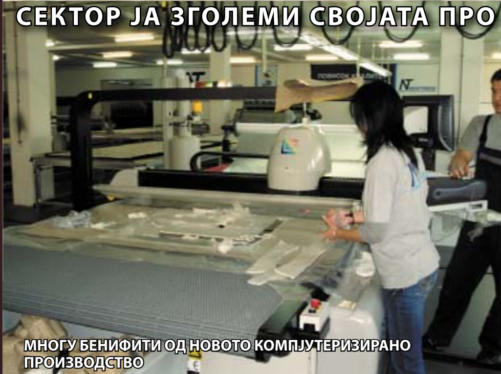
МНОГУ БЕНИФИТИ ОД НОВОТО КОМПЈУТЕРИЗИРАНО ПРОИЗВОДСТВО

Бенифити од новото компјутерски потпомогнато производство се: зголемување на профитот, создавање раст на приходот, проширување на базата на клиенти и зголемување на квалитетот на производот. Покрај ова, со овој автоматизиран процес може да се намалат и производствените трошоци, да се намали времето за одговор на пазарот, максимално да се искористат ткаенините и да се подобрат продуктивноста и ефикасноста.