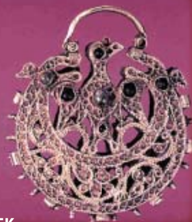
ЛУКСУЗНИ ОБЕТКИ ОД XIV ВЕК - ГОРНО ОРИЗАРИ, КОЧАНИ