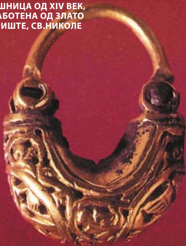
НАУШНИЦА ОД XIV ВЕК, ИЗРАБОТЕНА ОД ЗЛАТО - ЃУРИШТЕ, СВ.НИКОЛЕ