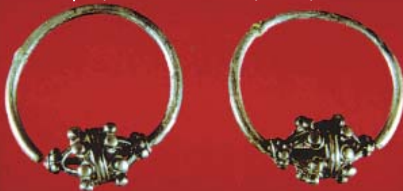
НАУШНИЦА ОД XII ВЕК, ИЗРАБОТЕНА ОД СРЕБРО, ГРАНУЛАЦИЈА, ФИЛИГРАН - ТРНЧЕ, СТРЕА, НЕГОТИНО

ните чувства на носителот. Наспроти прстените кои биле поконзервативни по својата форма, наушниците и обетките помасовно се употребувале. Во средновековието тие биле употребувани и од возрасните и од децата, од богатите и од сиромашните, од жените и од мажите. Мажите ги носеле обетките, главно, на едното уво како амајлија.