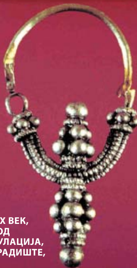
ОБЕТКА ОД IX-X ВЕК, ИЗРАБОТЕНА ОД СРЕБРО, ГРАНУЛАЦИЈА, ФИЛИГРАН - ГРАДИШТЕ, ПРИЛЕП

Книгата е преведена на англиски јазик со помош на Нада Андоновска, а содржи повеќе од 70 колор фотографии изработени од Дарко Николовски.