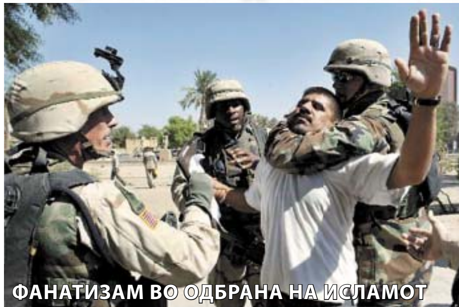
ФАНАТИЗАМ ВО ОДБРАНА НА ИСЛАМОТ

Пред две години од Националната нуклеарна лабораторија во Лос Аламос во Њу Мексико исчезнале десеттина дискови со исклучително важни податоци за нуклеарната програма. Станува збор за втор таков случај, а првиот сè уште не е расветлен. Очигледно се работи за големи пропусти во обезбедувањето на ваквите објекти. Се уфрлуваат луѓе кои навидум изгледаат пристojни, а потоа претресуваат и одземаат сè што е вредно и значајно за безбедноста на државата. Тогаш прв пат американските федерални органи проговорија за постоењето на т.н. бели терористи. Најмногу ги има од Балканот, но службите не сакаат да зборуваат за тоа и ги занемаруваат фактите дека најбројни меѓу нив се Бошњациите и Албанците. Во третирањето на исламот и фундаментализмот отсекогаш акцентот се ставал врз Босна, додека Косоварите биле занемарени и покрај силните докази дека се вклучени во диверзии и са-