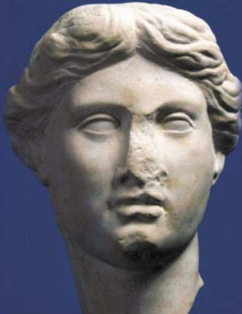
ГЛАВА НА МЛАДА ЖЕНА - СЕ ПРЕТПОСТАВУВА ДЕКА Е КОПИЈА НА НЕКОЕ ДЕЛО ОД ДОЦНИОТ V ВЕК ПР. Н. Е. ОРИГИНАЛОТ Е ВО МЕРМЕР, А ПРОНАЈДЕН Е НА ЛОКАЛИТЕТОТ СТОБИ.

одушевување на публиката која бара поголема дифузија на тие дела. Во концептот на изложбата вклучена е и земјата домакин со свои три експонати, "Глава на млада жена", копија во гипс, најдена на археолошкиот локалитет Стоби. Оригиналот е од доцниот V век пр.н.е. "Сатир во игра" е од најстарите вајарски дела во Македонија, кои се јавуваат во бронза во Стоби. Изложбата копија во гипс на сатирот од Стоби е копија на копијата од оригиналот кој денес се наоѓа во Народниот музеј во Белград. Датира од II век пр.н.е. "Вокативен релјеф на тракиски коњаник" е експонат пронајден во селото Семениште, Скопско, а изработен во некоја провинциска работилница, веројатно во IV век.