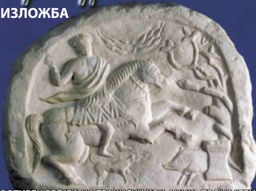
ВОТИВЕН РЕЛЈЕФ НА ТРАКИСКИ КОЊАНИК - ПРОНАЈДЕН Е ВО СЕЛО СЕМЕНИШТЕ, СКОПСКО, А ИЗРАБОТЕН Е ВО НЕКОЈА ПРОВИНЦИСКА РАБОТИЛНИЦА, ВЕРОЈАТНО ВО IV ВЕК.