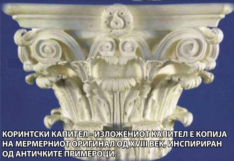
КОРИНТСКИ КАПИТЕЛ - ИЗЛОЖЕНИОТ КАПИТЕЛ Е КОПИЈА НА МЕРМЕРНИОТ ОРИГИНАЛ ОД XVIII ВЕК, ИНСПИРИРАН ОД АНТИЧКИТЕ ПРИМЕРОЦИ.