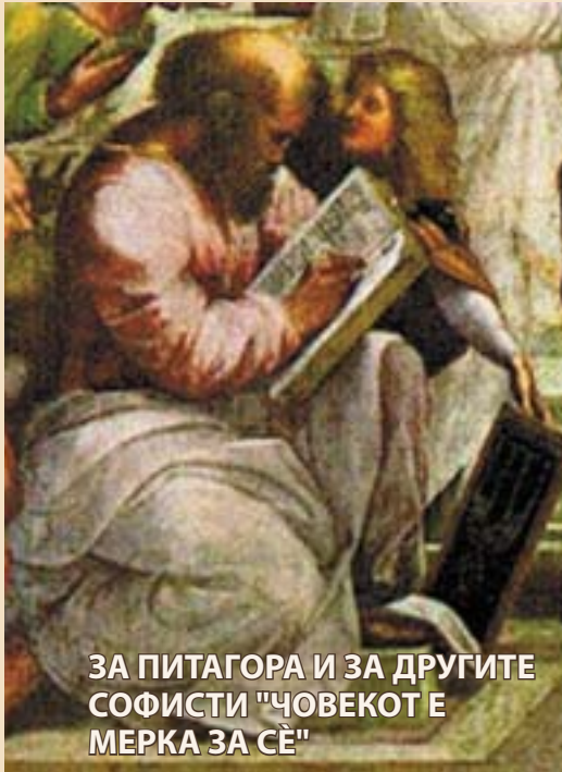
ЗА ПИТАГОРА И ЗА ДРУГИТЕ СОФИСТИ "ЧОВЕКОТ Е МЕРКА ЗА СЕ"

Древната филозофија и древната медицина во основа ја имаат космичката традиција. Мораме да ја покажеме и сличноста на Аристотел и на Хипократ и