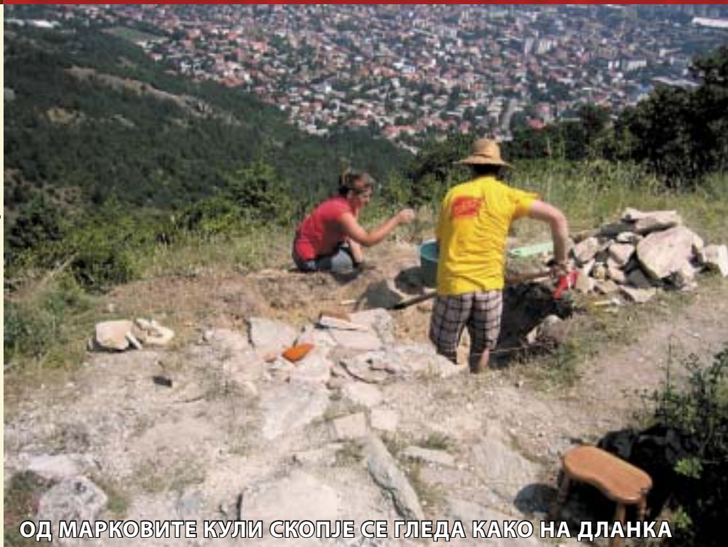
ОД МАРКОВИТЕ КУЛИ СКОПЈЕ СЕ ГЛЕДА КАКО НА ДЛАНКА

Интересен е апострофот кој се јавува меѓу овие два периода. Имаме престанок на активност на населбата меѓу овие два периода од почетокот на VII па сè до IX век. Тоа значи дека со навлегувањето на варварите од север престанува животот на населбите од цела Македонија.