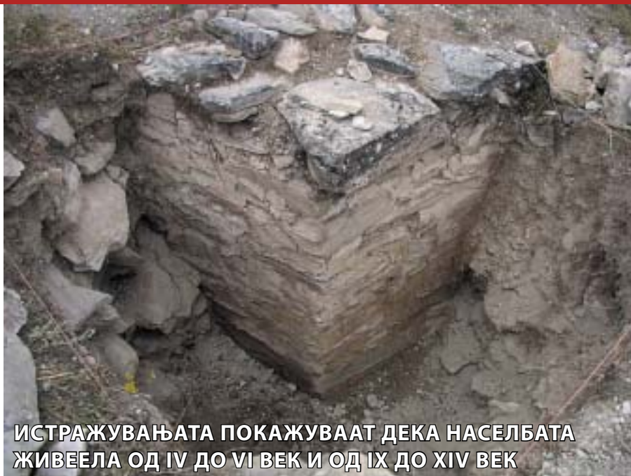
ИСТРАЖУВАЊАТА ПОКАЖУВААТ ДЕКА НАСЕЛБАТА ЖИВЕЕЛА ОД IV ДО VI ВЕК И ОД IX ДО XIV ВЕК

"Интересен е апострофот кој се јавува меѓу овие два периода. Имаме престанок на активност на населбата меѓу овие два периода од почетокот на VII па сè до IX век. Тоа значи дека со навлегувањето на варварите од север престанува животот на населбите од цела Македонија. Тој период е познат како мрачен период. Со навлегувањето на овие племиња добиваме една нова културна сатисфакција, ново културно