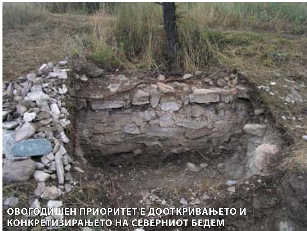
ОВОГОДИШЕН ПРИОРИТЕТ Е ДООТКРИВАЊЕТО И КОНКРЕТИЗИРАЊЕТО НА СЕВЕРНИОТ БЕДЕМ

Локалитетот Маркови кули е откриен во периодот 1952/1954 година, а некои информации кажуваат дека уште Артур Еванс, англиски археолог и патеписец, при крајот на XIX и почетокот на XX век кога престојувал во Скопје, забележал повеќе локалитети, меѓу кои е и Маркови кули. Првите истражувања се направени дури во 1975/1978 година од страна на Музеј на град Скопје.