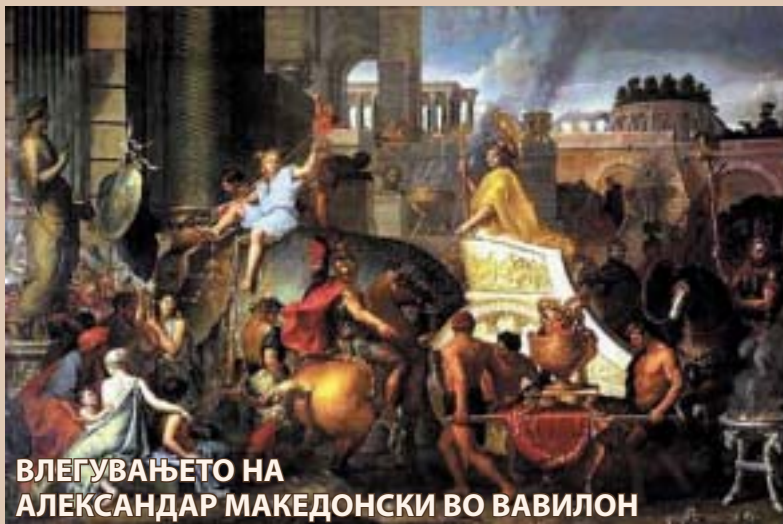
ВЛЕГУВАЊЕТО НА АЛЕКСАНДАР МАКЕДОНСКИ ВО ВАВИЛОН

Во нив Македонците беа поставувани како топовско месо, едни спроти