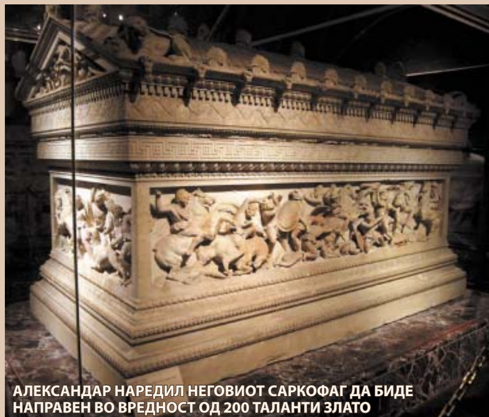
АЛЕКСАНДАР НАРЕДИЛ НЕГОВИОТ САРКОФАГ ДА БИДЕ НАПРАВЕН ВО ВРЕДНОСТ ОД 200 ТАЛАНТИ ЗЛАТО

Објавувањето на тестаментот во 1900 година во тогашна Европа предизвика шок кај владите на Србија, Бугарија и Грција, кои со благослов на