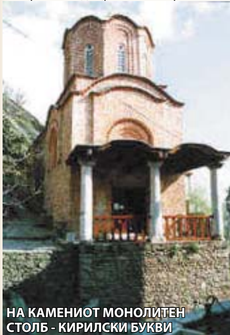
НА КАМЕНИОТ МОНОЛИТЕН СТОЛБ - КИРИЛСКИ БУКВИ

Исто така, на северниот каменен монолитен столб од спомнатиот трем се забележува натпис испишан со кирилски букви.