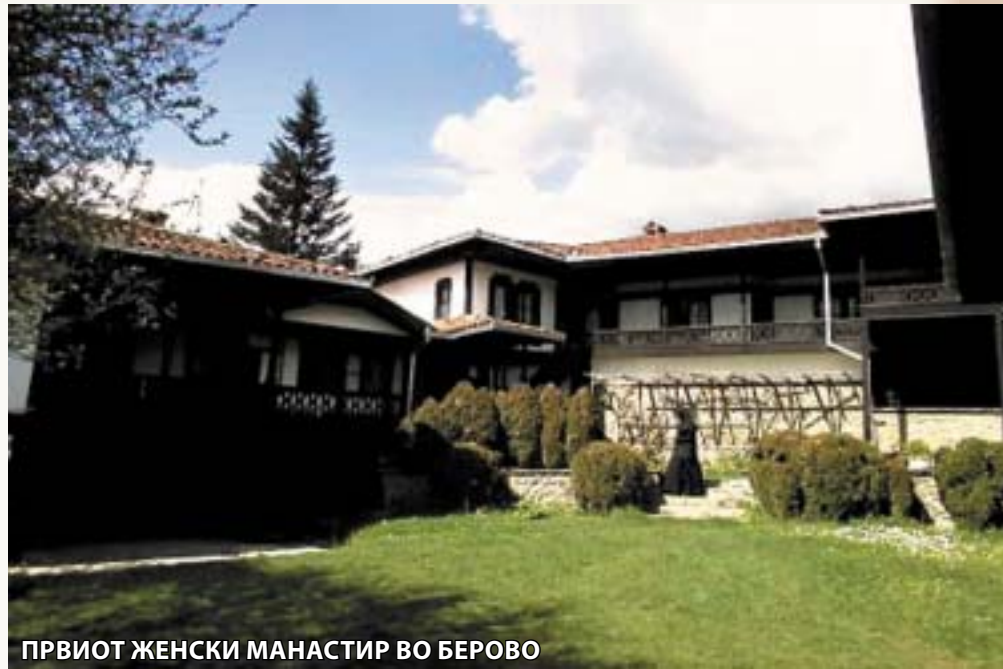
ПРВИОТ ЖЕНСКИ МАНАСТИР ВО БЕРОВО

Постои една легенда која зборува за нејзината изградба, како и за тешките услови под кои таа се одвивала. Според неа, старата црква "Свети Ѓорѓи" која се наоѓала во источниот дел на сегашно Берово, на почетокот на XIX век не можела да ги задоволи потребите на верниците. Поради тоа, беровчани решиле да изградат нова црква во близина на старата, во местото наречено Могила. За да се изгради нова