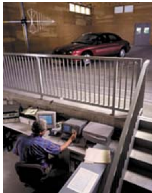
ДЕЛ ОД ИСТРАЖУВАЧКИТЕ ЛАБОРАТОРИИ НА АМЕРИКАНСКИОТ ГИГАНТ

Корисникот на слободната зона е ослободен од плаќање придонеси, такси и други давачки за комуналии за градежно земјиште, приклучок на водоводна, канализациона, топловодна, гасоводна и електроенергетска мрежа.