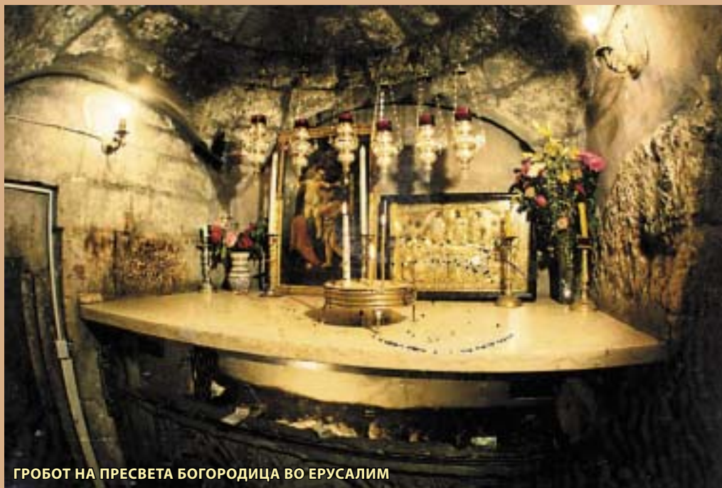
ГРОБОТ НА ПРЕСВЕТА БОГОРОДИЦА ВО ЕРУСАЛИМ

Овде на Нејзиниот Гроб се чувствува еден интимен разговор на човечката душа со Богородица.