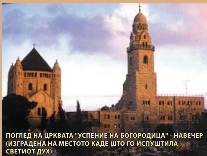
ПОГЛЕД НА ЦРКВАТА "УСПЕНИЕ НА БОГОРОДИЦА" - НАВЕЧЕР (ИЗГРАДЕНА НА МЕСТОТО КАДЕ ШТО ГО ИСПУСТИЛА СВЕТИОТ ДУХ)

Зад пештерата на Гробот, на празникот Успение на Пресвета