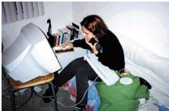
УЧЕЊЕ ОД МАЛИ НОЗЕ ЗА ПОГОЛЕМА ПЛАТА ВО ИДНИНА

Во светот вообичаена практика е платите на менаџерите, бонусите и акциите кои ги поседуваат челните луѓе во компанијата, која ја управуваат, да бидат јавно објавени. Но, кај нас ова не е практика и овој тип на податок сè уште се смета за деловна тајна.