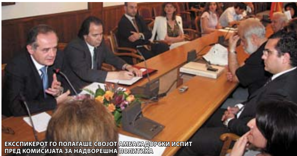
ЕКССПИКЕРОТ ГО ПОЛАГАШЕ СВОЈОТ АМБАСАДОРСКИ ИСПИТ ПРЕД КОМИСИЈАТА ЗА НАДВОРЕШНА ПОЛИТИКА