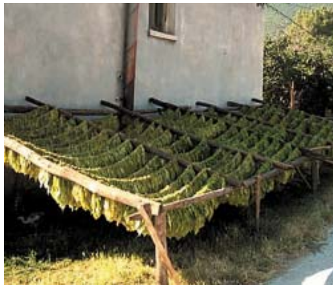
СУВ ТУТУН ЗА ИСУШЕНИ ЦЕБОВИ