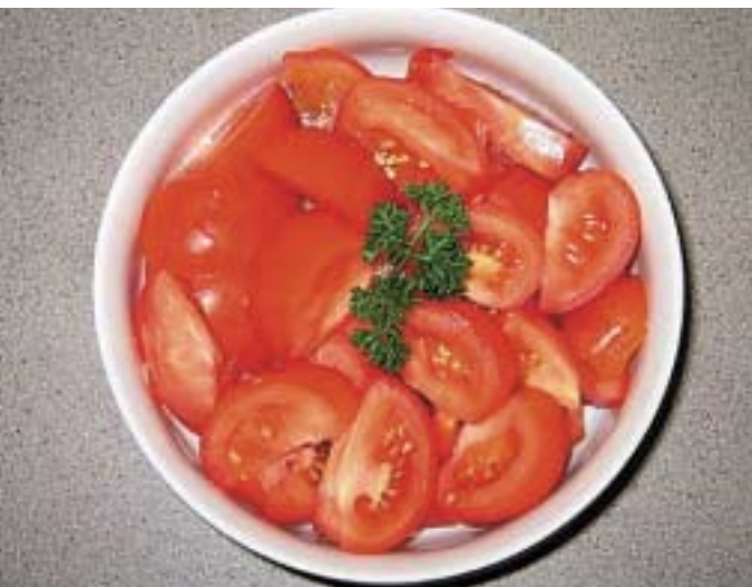
НА ТРПЕЗА СУПЕР, НО ДА ГИ ПРОИЗВЕДЕШ И НАПЛАТИШ, МАКА ГОЛЕМА