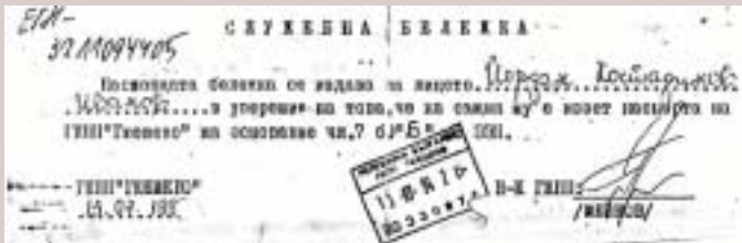
БЕЛЕШКА ЗА ОДЗЕМЕНИОТ ПАСОШ

право, Французин. Во однос на ова дело имавме можност да ги изложиме нашите проблеми, а адвокатот кажа дека ние бараме децата од Пиринска Македонија да се школуваат на македонски јазик, да имаме радио, телевизија. Бугарскиот обвинител беше против нас и велеше дека ние ги нарушуваме мирот, спокојството итн. Бугарија беше осудена зашто ги спречуваше мирните протести од 1994 до 2001 година. Казната за неа беше пресметана во француски франци, односно во висина на околу сегашни 11.000 евра, кои сè уште не се исплатени од Бугарија. За време на судењето Судот ги отфрли си-