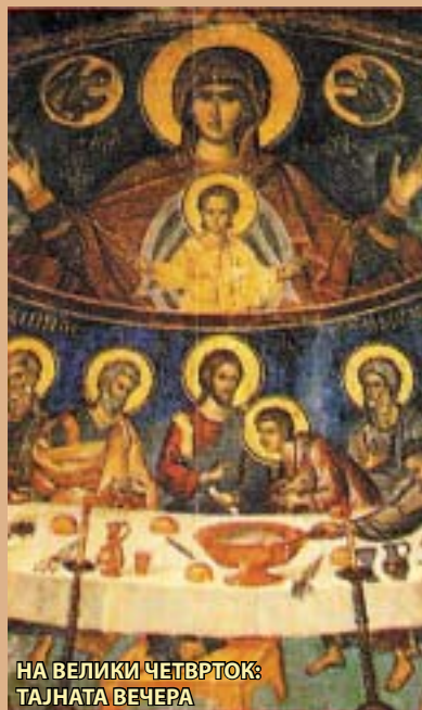
НА ВЕЛИКИ ЧЕТВРТОК: ТАЈНАТА ВЕЧЕРА