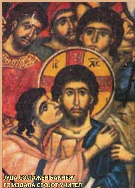
ЈУДА СО ЛАЖЕН БАКНЕЖ ГО ИЗДАВА СВОЈОТ УЧИТЕЛ