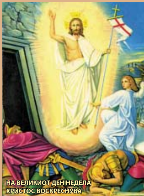
НА ВЕЛИКИОТ ДЕН НЕДЕЛА ХРИСТОС ВОСКРЕСНУВА