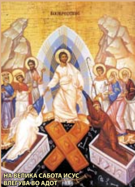
НА ВЕЛИКА САБОТА ИСУС ВЛЕГУВА ВО АДТОТ

Со благослов на Неговото Високо Преосвештенство Митрополит Европски г. Горазд