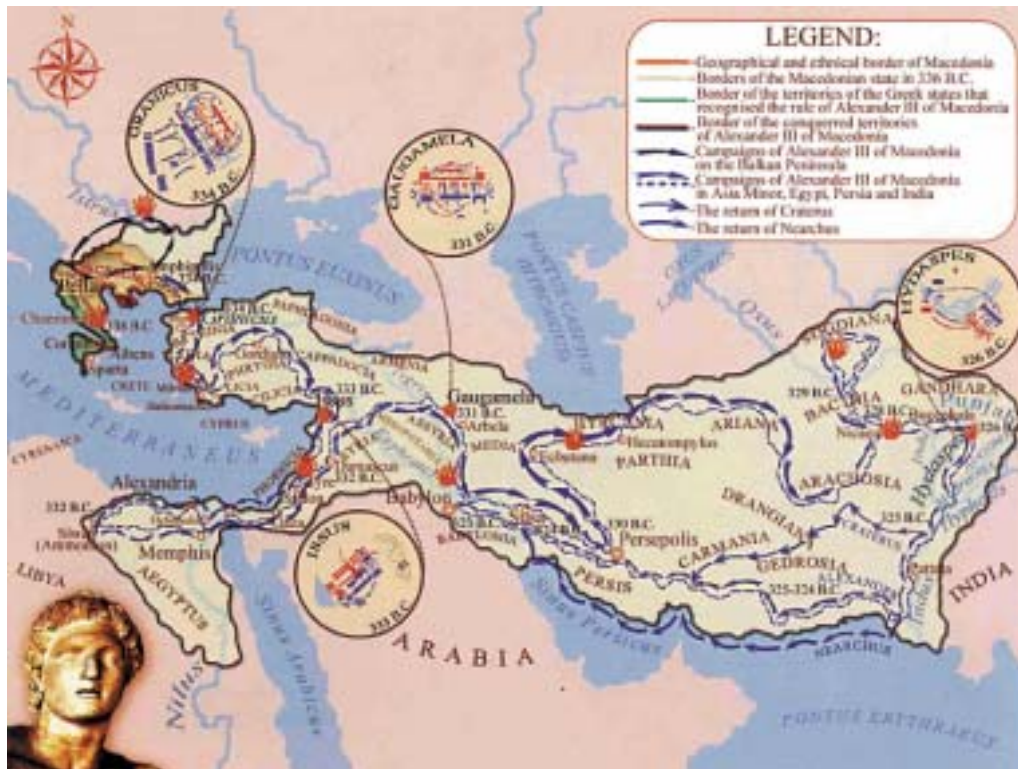
ДРЖАВАТА НА АЛЕКСАНДАР III МАКЕДОНСКИ

Александар е прв кој го вовел штабното, односно тимското раководење и тоа многу успешно се покажало во практиката на теренот. Штабното раководење се покажало како успешно и во време на подготовките на походите. Тој сметал дека основен услов за крајниот успех се целосните подготовки. Александар извршил реорганизација на војската. Формирал помали единици од мешовит состав (специјални сили), ја засилил обуката, ја зацврстил дисциплината, ја зголемил маневриската способност и со тоа ги подготвил силите за војување во пустински и во планински предели, во зимски и во летни услови, преку ден и ноќ. Покрај тоа, постојано ги усовршувал борбената техника и воената вештина. Со формирањето на штабот, кој се состоел од врвни генерали, научници, ле-