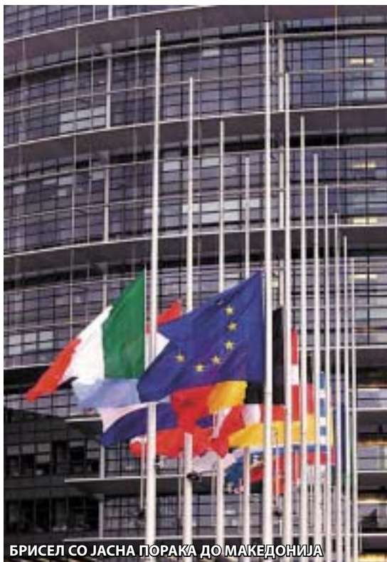
БРИСЕЛ СО ЈАСНА ПОРАКА ДО МАКЕДОНИЈА

повеќе од неопходна сега во предизборието, или поточно доколку сака да добие уште еден мандат. Но, и тоа не е гаранција (барем не за него), дека Европа цврсто ќе застане зад македонската агенда, бидејќи покрај фер избори, таа од нас бара и темелни реформи во судството и во јавната администрација, но и создавање бизнис клима, од едноставна причина поради тоа што "старата дама" има доволно проблеми и самата со себе, на полето на економијата и вработувањето, што е сериозна пречка за проширувањето на Унијата, кон која ние тежнееме.