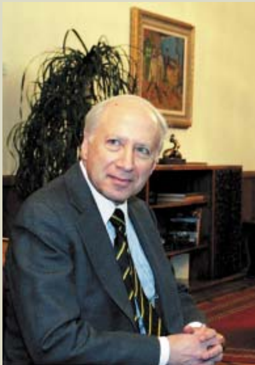
НИМИЦ НЕМА НОВИ ПРЕДЛОЗИ ЗА ИМЕТО

Република Македонија се обидува да ги затопли односите со Република Грција, или можеби тоа нам само така ни се чини, поради дипломатската офанзива на шефицата на грчката дипломатија Дора Бакојани, која при посетата на Стејт департаментот се обиде на маса повторно да го стави прашањето за Македонија.