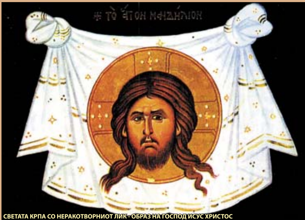
СВЕТАТА КРПА СО НЕРАКОТВОРНИОТ ЛИК - ОБРАЗ НА ГОСПОД ИСУС ХРИСТОС

Б лагодарствената химна кон Пресвета Богородица - Акатист е потреба на целиот христијански свет за добивање морална сила и поддршка од посредничката меѓу небото и земјата, заштитничката на светот, патеводителката во вечниот живот, Пресвета Богородица. Богоневестата преку која ни дојде помилувањето со Бога, со молитвите упатени кон Бога, е закрилница не само на поединци кои ја бараат Нејзината помош, туку и бранителка на православните држави, а тоа најдобро се гледа преку Акатистот на Богородица, кој е составен по повод ослободувањето на Цариград со Нејзина помош. Всушност, отука потекнува и изворната смисла на овој голем Богородичен празник, на кој се воспеваат чудесните настани во Светата