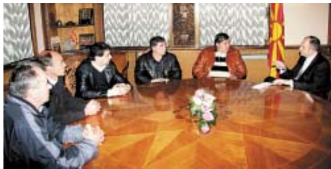
БУЧКОВСКИ НАЈДЕ ВРЕМЕ ЗА МАКИТЕ НА ЛОЗАРИТЕ

крај има околу 5.000 производители на грозје, а со работата не можеме да ги покриеме ниту трошоците, а за печалба и да не зборуваме. Јас имам засадено пет декари земјиште, а ништо не сум добил. Со кои пари да се платат орањето, прскањето, маката. А за природните непогоди, како замрзнувањето, градот, и да не зборувам. Со замрзнувањето се уништува 50-60 отсто од грозјето. Сè уште не сме почнале со закројување на лозјето, очекуваме да видиме што преживеало од зимата. Тешко преживуваме, веќе пет месеци сме во исчекување да добијеме пари за грозјето. Надежта ја изгубивме и воопшто не очекуваме дека некој може да ја 'оправи' работата, ниту Здружението, ниту политичарите", очигледно безнадежен вели еден кавадарчанин.