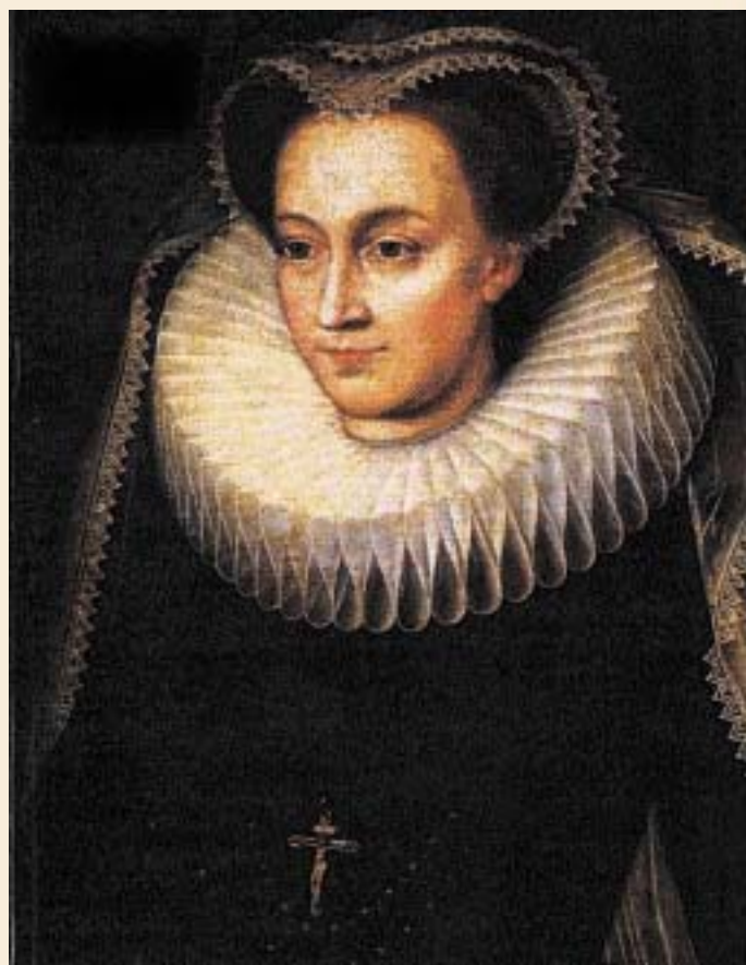
ПРИНЦЕЗАТА МЕРИ СТУЈАРТ

Делуваат зачудувачки и фрапантни претскажувањата на пророкот за т.н. религиозни војни, во кои умреле илјадници Европејци. Имено, непријателите на династијата Вало, со цел да ја дестабилизираат Франција, ја разгореле цивилната ре-