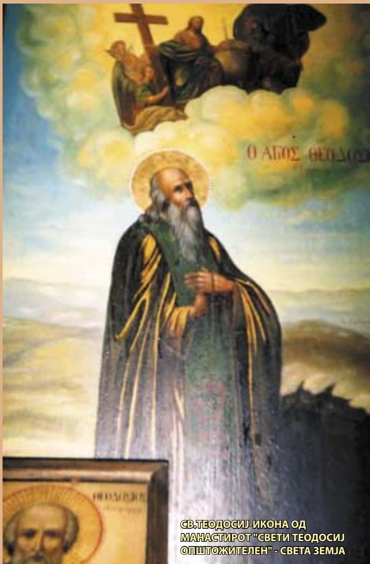
СВ.ТЕОДОСИЈ-ИКОНА ОД МАНАСТИРОТ "СВЕТИ ТЕОДОСИЈ ОПШТОЖИТЕЛЕН" - СВЕТА ЗЕМЈА

Додека Константин Велики го забранил прогонувањето на христијаните, Теодосиј Велики го забранил во својата држава идолското жртвопринесување. Успешно се борел против еретиците. Од