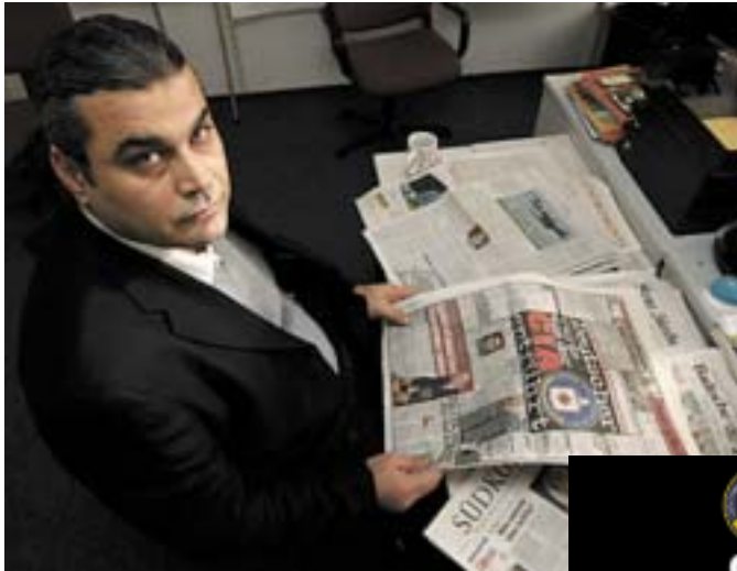
КОЈА Е ВИСТИНАТА ЗА ЕЛ МАСРИ?

клучено Република Македонија да биде изненадена со посета од Советот на Европа, за на лице место да се истражува дали во нашата земја постојат тајни затвори на ЦИА, и до каде е случајот со Ел Масри.