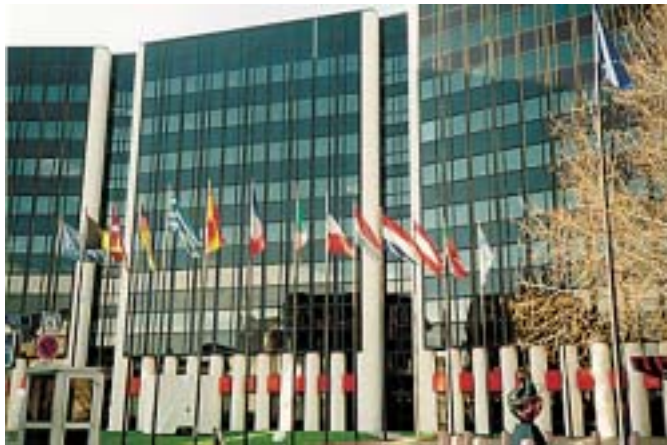
СОВЕТОТ НА ЕВРОПА ВО ЦЕЛОСНА ПОТРАГА