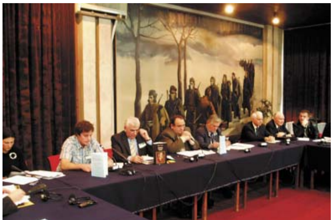
ПОТЕНЦИРАНИ БАРАЊАТА НА ГОРАНИТЕ