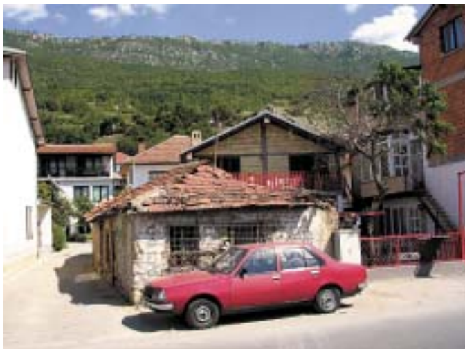
ПЕШТАНИ - ЕДИНСТВЕНО СЕЛО СО ДЕТАЛЕН УРБАНИСТИЧКИ ПЛАН

е константно население, односно статистички гледано бројот на населението со години назад е ист. На пример, толкав бил бројот на населението и во Пописот од 1951,