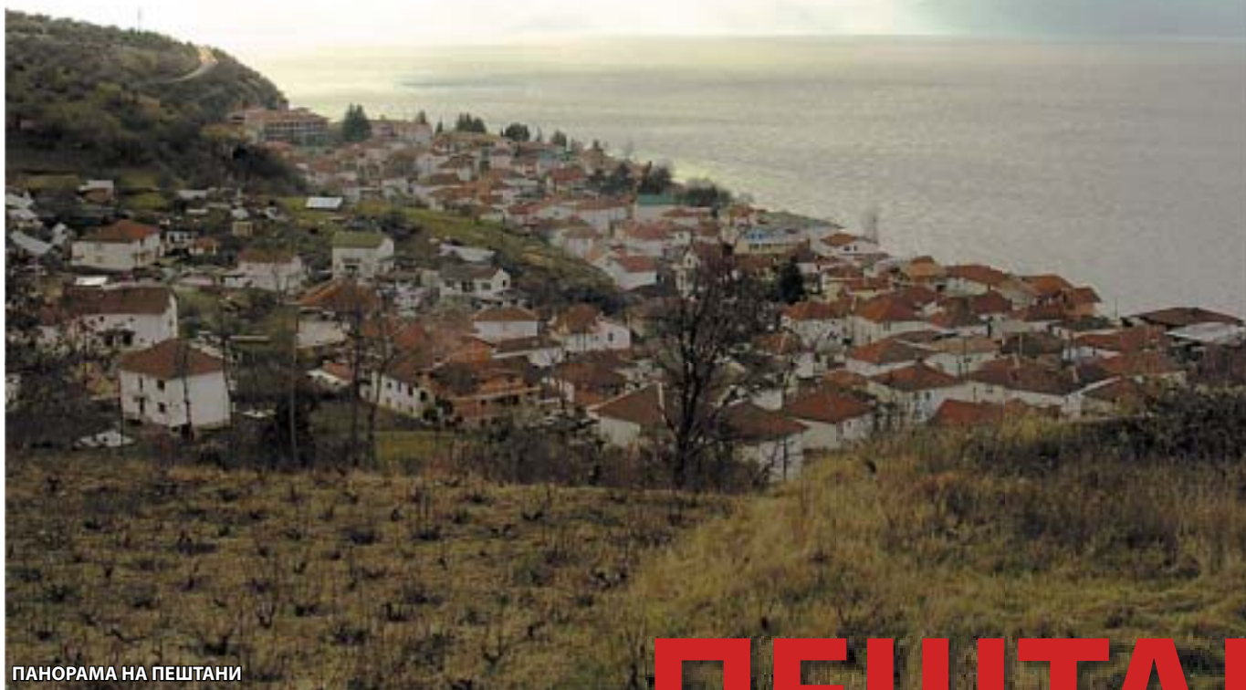
ПАНОРАМА НА ПЕШТАНИ