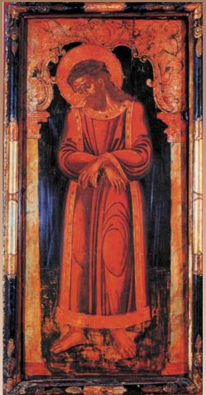
СТРАДАЊЕТО НА ХРИСТОС

Христовиот Покров - Плаштаница: Во Торино, Ита-