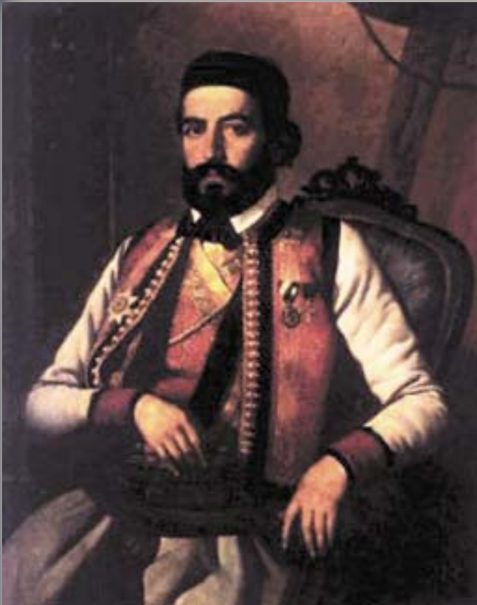
ПЕТАР ПЕТРОВИЌ ЊЕГОШ

Односот кон Бог кај масоните е однос кон Големият Архитект, Творецот, но безличен со неприпадност кон било која религија, затоа што сите познати религии треба да се тргнат од сцената и да се постави ново верување во новиот предводник.