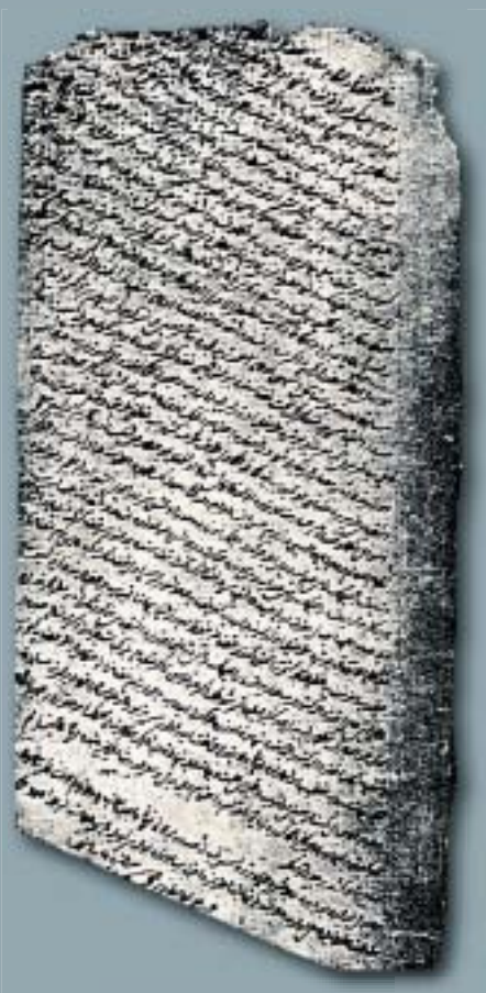
ФАКСИМИЛ ОД ТУРСКИ ДОКУМЕНТ ВО КОЈ СЕ ОПИШУВААТ СТРАДАЊАТА НА МАКЕДОНСКОТО НАСЕЛЕНИЕ ВО НЕКОЛКУ КРАИШТА НА МАКЕДОНИЈА, КОИ МУ ГИ НАНЕСУВАЛЕ РАЗБОЈНИЦИТЕ.