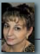
■ Пишува: Силвана БЛАЖЕВА

Б алканските народи, особено во периодот на транзиција и на преминување од едно во друго општествено уредување, при што се формираа повеќе самостојни држави, настојуваат да го вратат тркалото на времето и што повеќе на светот да му откријат за своето минато, да обелоденат, односно да им дадат своја конотација и видување на одредени случувања. Би можело да се квалификува како непристојност поради незаинтересираност или од други цели со задни намери нашето однесување кон историската наука на која од "непознати" причини не ѝ се овозможува проучување, доку-