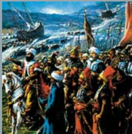
ОСМАНЛИИТЕ ГО ПРЕМОЛЧУВАА УБИВАЊЕТО НА НЕВИНИТЕ МАКЕДОНЦИ

што дошле до многу важни и релевантни податоци врз чија основа може во историската наука да се постави одредена статистика за последиците од ова триековно разбојништво, особено за бројот на Македонците кои биле жрт-