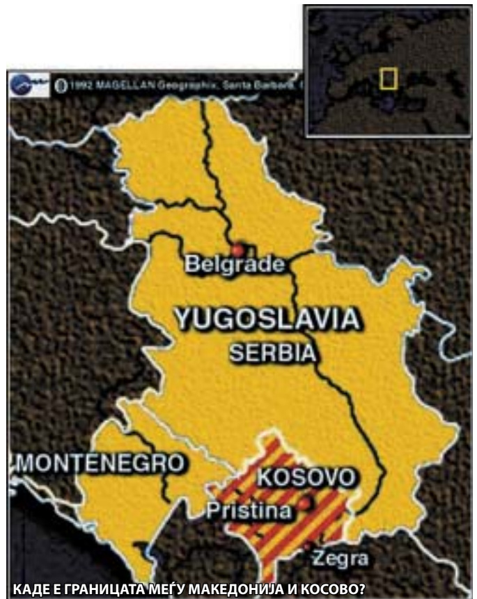
КАДЕ Е ГРАНИЦАТА МЕЃУ МАКЕДОНИЈА И КОСОВО?

Речиси на самиот старт на отворањето на преговорите за решавање на статусот на Косово, кои и официјално почнаа со седница на Советот за безбедност при Обединетите нации, се чини дека косовското буре барут е повторно пред ескалирање.