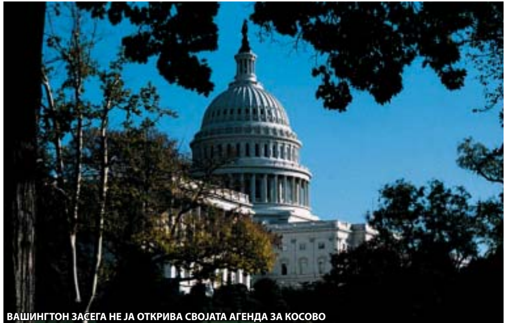
ВАШИНГТОН ЗАСЕГА НЕ ЈА ОТКРИВА СВОЈАТА АГЕНДА ЗА КОСОВО

Бугарскиот претседател Георги Пврванов ја повика меѓународната заедница внимателно да го разгледува