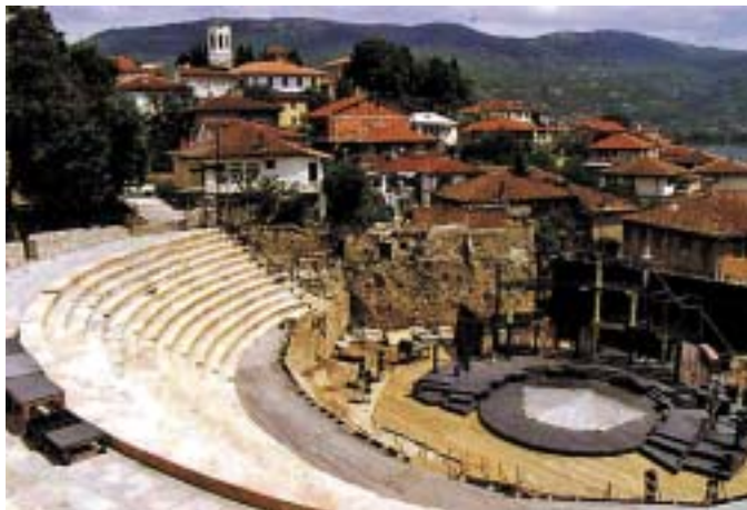
■ Пишува: Ружица ГОЧЕВСКА