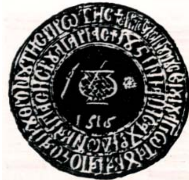
ОТИСОК НА МУЗЕЈСКИОТ ПЕЧАТ НА ОХРИДСКАТА АРХИЕПИСКОПИЈА ОД 1516 ГОДИНА