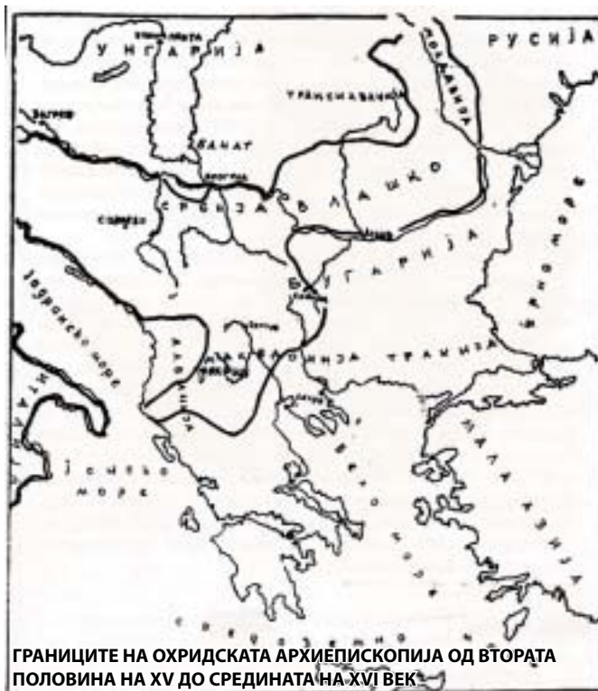
ГРАНИЦИТЕ НА ОХРИДСКАТА АРХИЕПИСКОПИЈА ОД ВТОРАТА ПОЛОВИНА НА XV ДО СРЕДИНАТА НА XVI ВЕК

"Значи, една ваква иницијатива покренува низа прашања, а нам најбитно ни е како Цариградската патријаршија постапувала пред толку години, бидејќи таа филозофија на однесување се провлекува низ подолга историја, а одредени делови или моменти од таквата политика се спроведуваат и ден денес. Ние треба да ја сфатиме филозофијата на однесувањето на Цариградската патријаршија и кон останатите православни цркви, за да можеме полесно да изведеме наша стратегија во црковната дипломатија, која ќе ги има предвид и актуелните случувања. Од таквото нејзино