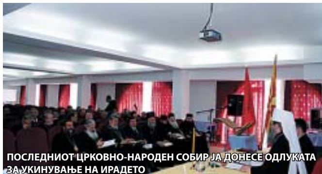
ПОСЛЕДНИОТ ЦРКОВНО-НАРОДЕН СОБИР ЈА ДОНЕСЕ ОДЛУКАТА ЗА УКИНУВАЊЕ НА ИРАДЕТО