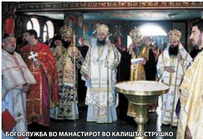
БОГОСЛУЖБА ВО МАНАСТИРОТ ВО КАЛИШТА-СТРУШКО