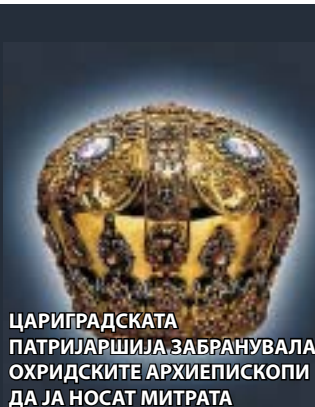
ЦАРИГРАДСКАТА ПАТРИЈАРШИЈА ЗАБРАНУВАЛА ОХРИДСКИТЕ АРХИЕПИСКОПИ ДА ЈА НОСАТ МИТРАТА