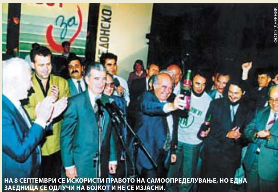
НА 8 СЕПТЕМВРИ СЕ ИСКОРИСТИ ПРАВОТО НА САМООПРЕДЕЛУВАЊЕ, НО ЕДНА ЗАЕДНИЦА СЕ ОДЛУЧИ НА БОЈКОТ И НЕ СЕ ИЗЈАСНИ.

☀ Ако по нешто сме познати тогаш тоа е што ниту една граѓанска иницијатива, ниту една форма на непосредна демократија, во оваа држава не успева, со исклучок на референдумот за независност кога прв и последен пат ја докажавме својата самосвесност како граѓани. Како кај нас се дефинира граѓанската иницијатива, кога очигледно се поистоветува со тоа "ајде да ја уриваме власта" или "да се договараме за изградба на локален пат"...?