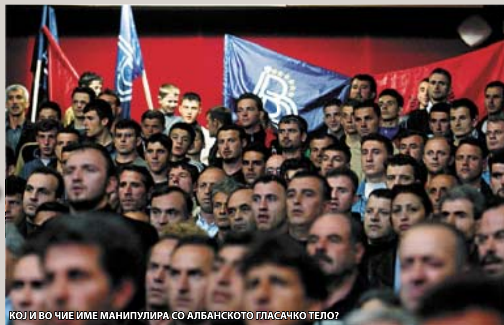
КОЈ И ВО ЧИЕ ИМЕ МАНИПУЛИРА СО АЛБАНСКОТО ГЛАСАЧКО ТЕЛО?