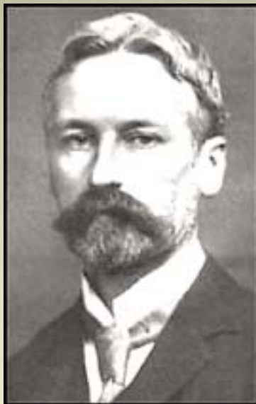
Хенри Вуд Невинсон (1856-1941)

Тој е роден во Лестер, Англија. Студирал на Универзитетот во Оксфорд. Талентиран писател и новинар. Пишувал за состојбите во Централна Африка, Азија, Исланд и во други земји. Во своето дело "Модерно ропство" ја изложил состојбата на домородците во Африка. Други значајни трудови му се: "Војна од триесет дена", "Лејдисмит", "Руска зора", "Новиот дух во Индија", "Битката на Дарданели" и други.