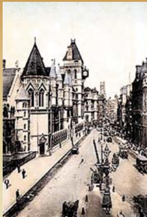
ЛОНДОН ВО 1925 ГОДИНА