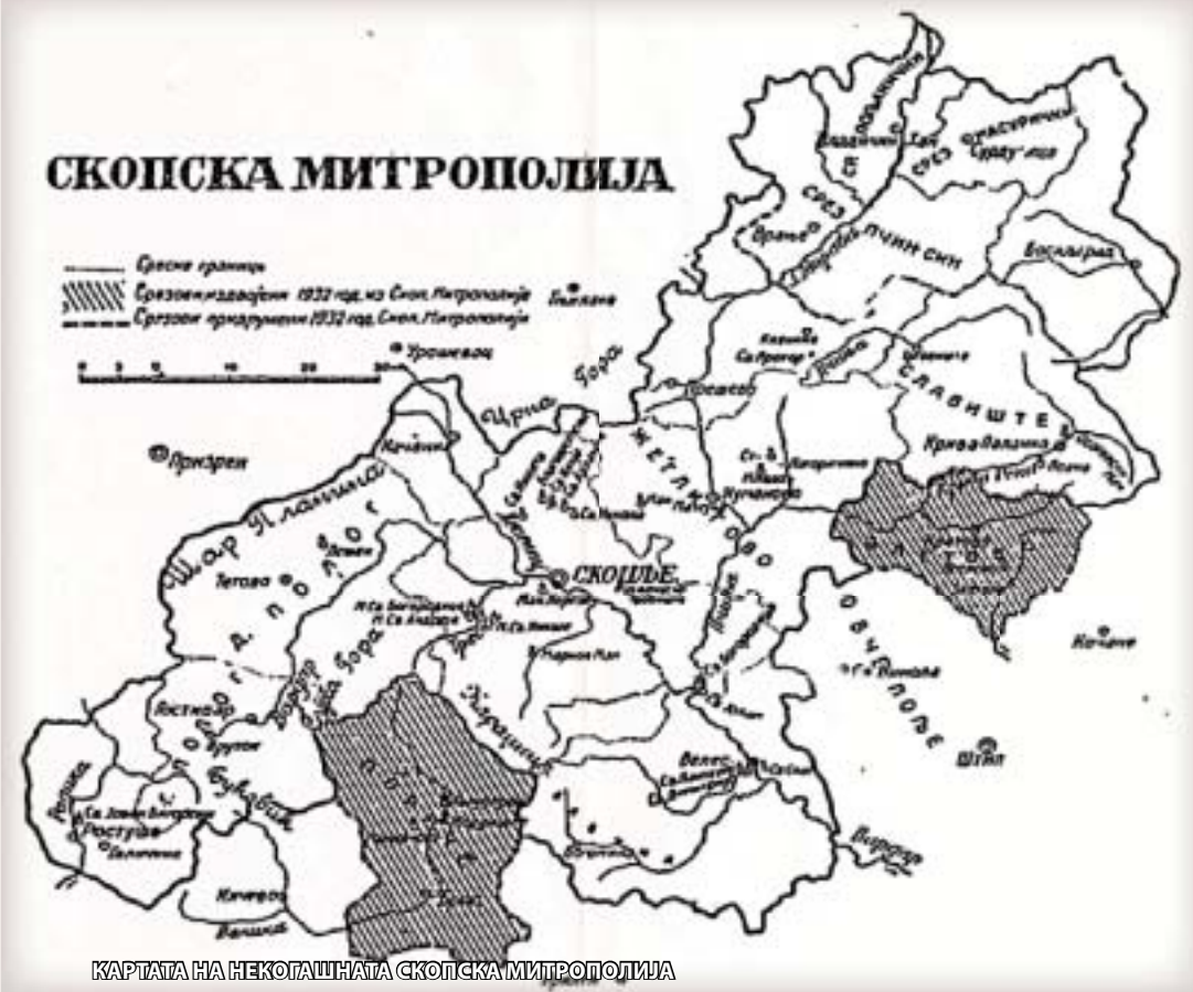
КАРТАТА НА НЕКОГАШНАТА СКОПСКА МИТРОПОЛИЈА