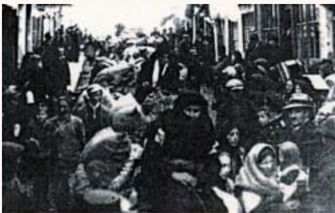
БЕГАЛЦИ ОД СЕЛО ЛАЗАРОПОЛЕ, ВО ОХРИД ЕСЕНТА 1943 Г.

правено на тој план. Ваквите тенденции се со цел да се разбие македонското национално ткиво, да се разведени македонското единство. Затоа треба да се укаже дека овие сегашни факти, кои се пишуваат во учебниците всушност се негативни, бидејќи за нив постојат докази. За нас е многу лошо историската вистина од Втората светска војна, или онаа меѓу двете светски војни, дури и од поновиот период, да се прикаже како вистина на одредена групација, луѓе кои наводно во одредено време во СРМ и во СФРЈ биле малтретирани, забранети или судени итн. Мислам дека се создава голем заговор против Македонија, со кој се разнебитуваат македонското национално ткиво, македонскиот народ, за на крај да се разнебити и македонската држава. Сè ова, сè што се случува со македонската историја и со македонската црква, и сè она што се случува околу Македонија, со негирањето на македонскиот народ, јазик, култура итн. всушност е добро фингирана игра, создадена и инструирана во центрите на соседните балкански безбедносни структури. Тоа се прави за да се уништи македонскиот народ, да ја снеса Македонија од балканските и од светските простори", нагласува Малковски.